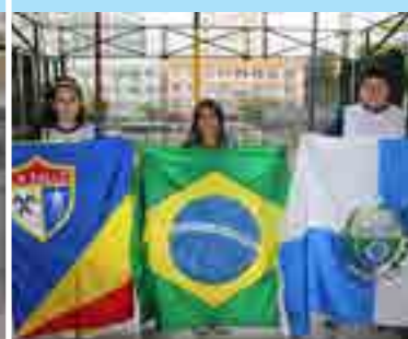
Independência do Brasil