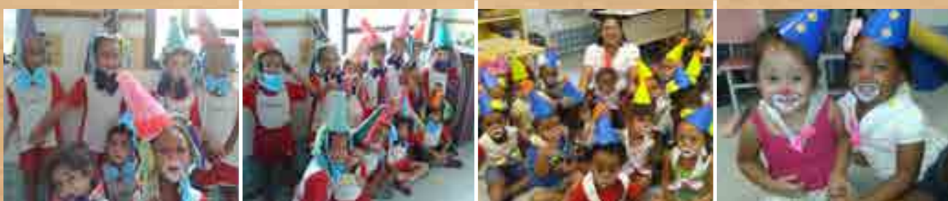
Dia do Circo