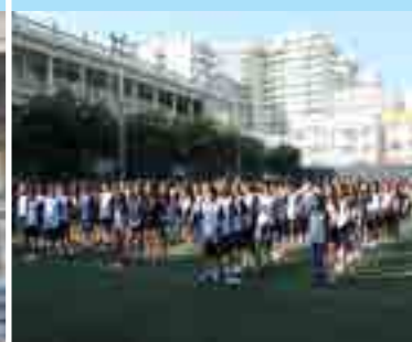
Dia do Educador