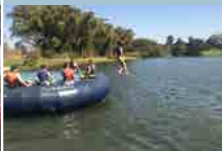
RepLago | 8º Ano do EF (05 a 09 de agosto)