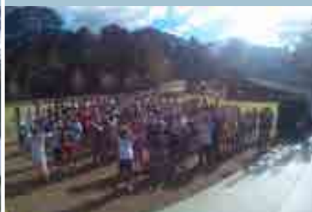
PaioI | 6º Ano do EF (21 a 24 de junho)