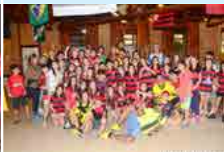
NR1 | 5º Ano do EF (21 a 24 de junho)