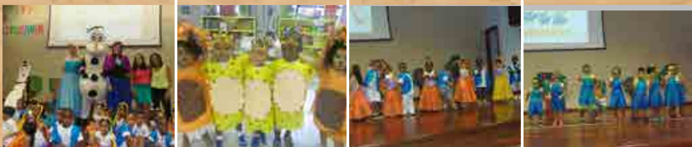
Mostra Literária 2015