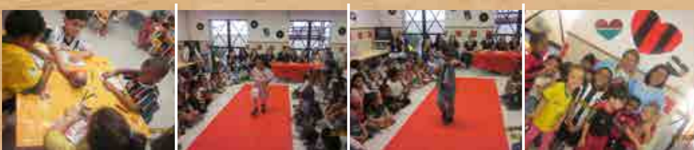
Semana da Criança