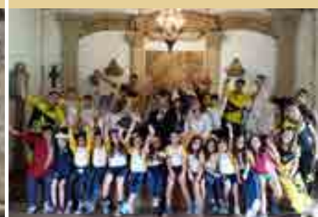
Fazenda Ponte Alta | 4º Ano do EF