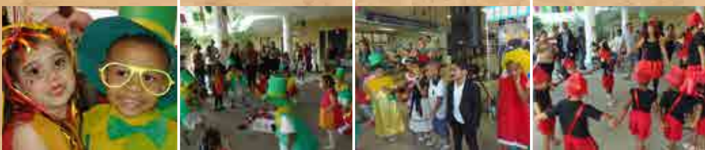
Festa do Folclore