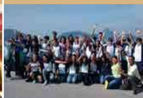
Forte de Copacabana | 8º Ano do EF