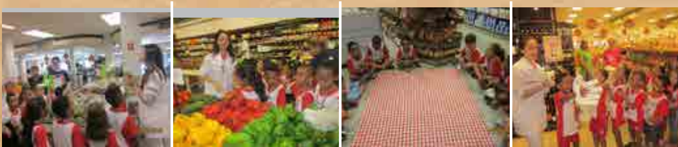
Visita ao Hortifruti