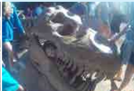
Carroção | 7º Ano do EF (20 a 29 de junho)