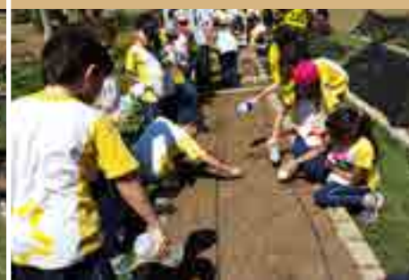
Projeto Água | 4º Ano do EF