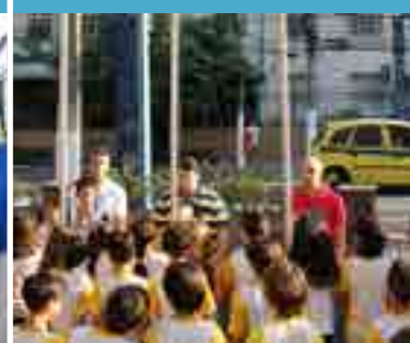
Dia dos Pais