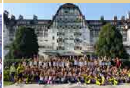
City Tour Petrópolis | 5º Ano do EF