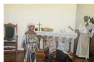
Celebrando a Páscoa