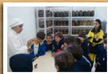
Museu do Mel – Apiário Amigos da Terra (Friburgo) - 3º ano do EF