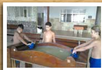
Casa Abel - 2º e 5º anos do EF