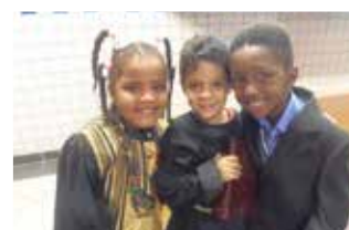
Semana de La Salle