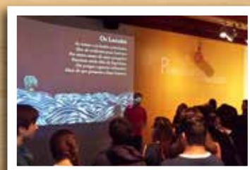
Museu Histórico Nacional - 1º ano do EM