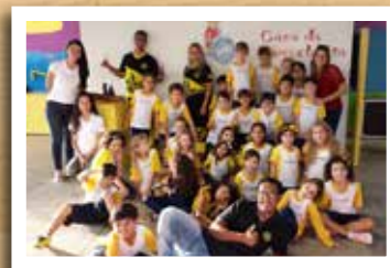
Casa da Descoberta (UFF) - 2º ano do EF