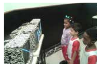
Visita à exposição InterConexões