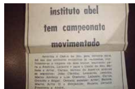
Nota na imprensa sobre o campeonato