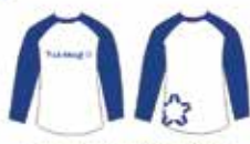
Blusa Azul e Branca Manga Longa*