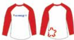
Blusa Vermelha e Branca Manga Longa*