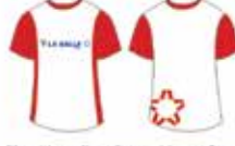
Blusa Vermelha e Branca Manga Curta*