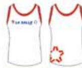
Regata Vermelha e Branca*