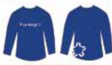
Blusa Azul Manga Longa*