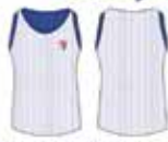
Regata Dupla Face Branca / Azul*