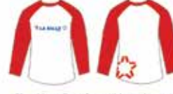
Blusa Vermelha e Branca Manga Longa*