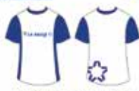
Blusa Azul e Branca Manga Curta*