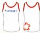
Regata Vermelha e Branca*