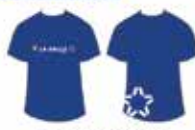
Blusa Azul Manga Curta*