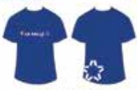
Blusa Azul Manga Curta*