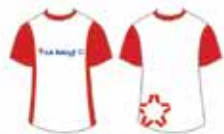
Blusa Vermelha e Branca Manga Curta*