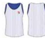
Regata Dupla Face Branca / Azul*