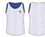
Regata Dupla Face Branca / Azul*