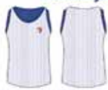
Regata Dupla Face Branca / Azul*