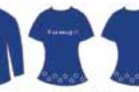
Blusa Azul Estrelas Brancas*