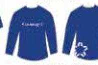
Blusa Azul Manga Longa*