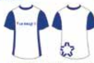
Blusa Azul e Branca Manga Curta*