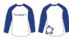
Blusa Azul e Branca Manga Longa*