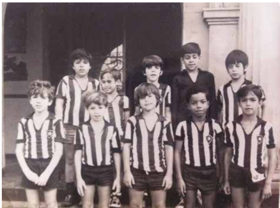
Equipe do Botafogo, vitoriosa no Campeonato de Futebol do Abel em 1970

chegada ao Itamaraty, em janeiro de 1986, pode ser considerada um divisor de águas, um momento importante para a diplomacia nacional.