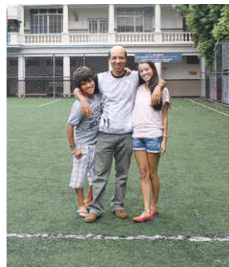
A família também visitou o campo de grama

– Acho importante que eles conheçam um pouco da minha história, que também é a deles. Afinal, se morássemos em Niterói, eles também seriam estudantes lassalistas – garantiu ele.