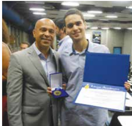
O ex-aluno recebendo a Láurea Acadêmica, das mãos do vice-reitor da UFF, em 2012.

espécie de vestibular para quem deseja fazer mestrado nas melhores universidades do país) e tive a grata satisfação de estar classificado para a turma da UFF/2013.