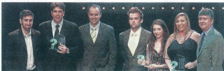
TROFÉU: finalistas do 5º prêmio Inovação na Educação

O projeto passa anualmente por reformulações em suas atividades, com objetivo de manter-se atualizado, atendendo as necessidades dos educandos e suas famílias.