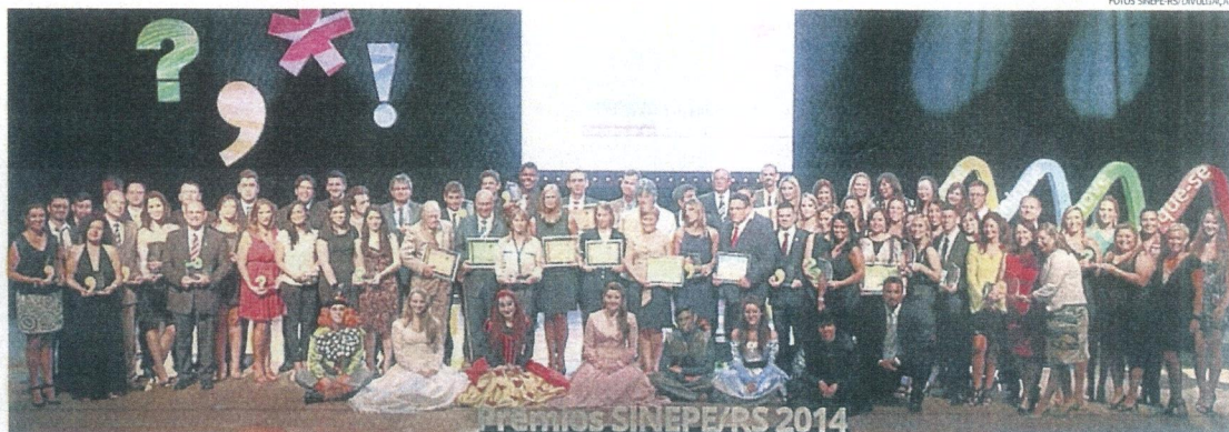
GRANDE FESTA: todos os premiados da noite em evento organizado pelo Sindicato do Ensino Privado do RS